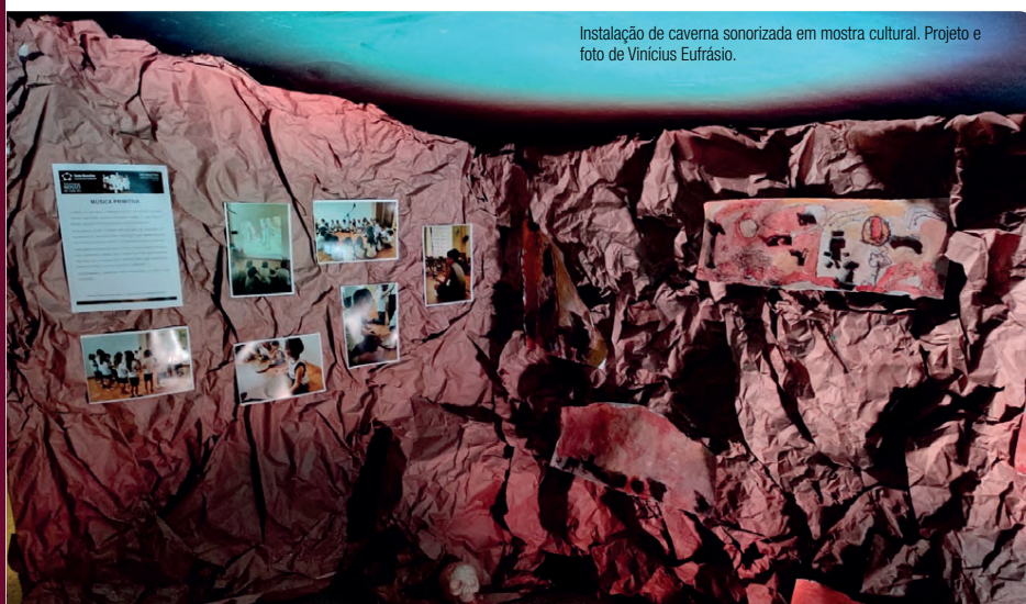
Quadro 2: Atividades musicais e sua relação com códigos da BNCC.