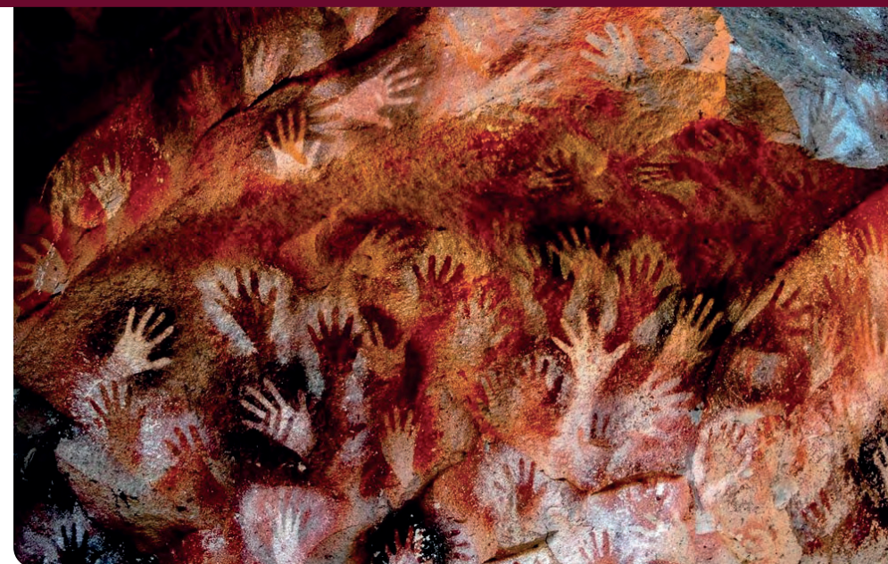
Cueva de las Manos, Santa Cruz, Argentina.

Outras possibilidades e desdobramentos podem surgir a partir das especificidades dos contextos. Escolas do campo podem promover interações com o patrimônio natural e geológico local, experiências acústicas em grutas em parceria com a área de Ciências, por exemplo (no box há indicações de vídeos incríveis). Estudantes do Piauí podem visitar o Sítio Arqueológico da Serra da Capivara, em projetos integrados de História, Geografia, Artes visuais e Música. A pintura das mãos em murais, à semelhança do painel da Cueva de las Manos, na Patagônia, Argentina, é um projeto de fácil realização muito apreciado pelos alunos e também bastante simbólico da impressão da identidade e autoria, prerrogativas da arte. A exploração de sonoridades de instrumentos artesanais feitos de materiais colhidos na natureza também desperta um interesse mais perene pela pesquisa sonora. Escolas com laboratórios de informática ou estúdios podem utilizar programas de gravação e edição para criação de trilhas sonoras com esses instrumentos, e assim por diante.