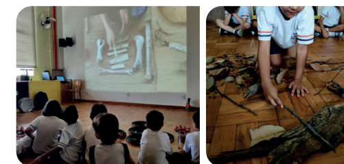
Projeto sobre instrumentos alternativos e pesquisa de materiais da natureza.