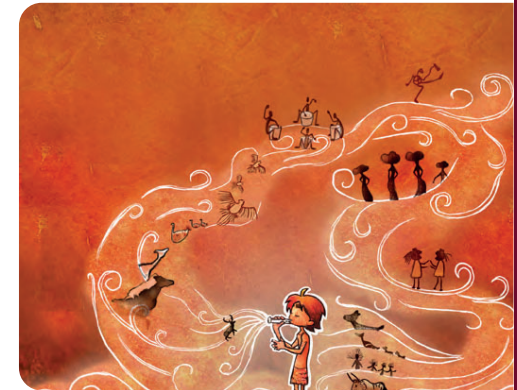
Imagem do curta-metragem A primeira flauta .

Assista ao curta-metragem de animação A primeira flauta : https://www.youtube.com/watch?v=U98blcScuFI