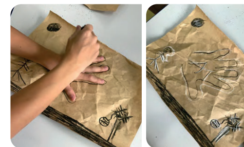
Elaboração de mural coletivo.

Outras possibilidades e desdobramentos podem surgir a partir das especificidades dos contextos. Escolas do campo podem promover interações com o patrimônio natural e geológico local, experiências acústicas em grutas em parceria com a área de Ciências, por exemplo (no box há indicações de vídeos incríveis). Estudantes do Piauí podem visitar o Sítio Arqueológico da Serra da Capivara, em projetos integrados de História, Geografia, Artes visuais e Música. A pintura das mãos em murais, à semelhança do painel da Cueva de las Manos, na Patagônia, Argentina, é um projeto de fácil realização muito apreciado pelos alunos e também bastante simbólico da impressão da identidade e autoria, prerrogativas da arte. A exploração de sonoridades de instrumentos artesanais feitos de materiais colhidos na natureza também desperta um interesse mais perene pela pesquisa sonora. Escolas com laboratórios de informática ou estúdios podem utilizar programas de gravação e edição para criação de trilhas sonoras com esses instrumentos, e assim por diante.